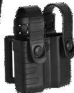
PORTA CARREGADOR DUPLO