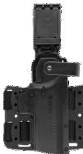
COLDRE UNIVERSAL EM POLÍMERO