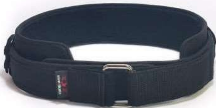
CINTO TÁTICO EM RIP STOP COM PROTEÇÃO LOMBAR