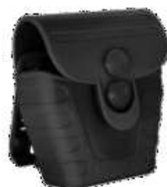
PORTA ALGEMA EM POLÍMERO